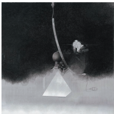
Bernard MONINOT. Chambre noire XXVI , 1980.

→ Thématiques proposées : performance, body art ; mise à l'épreuve du corps, projets d'expérimentations physiques, sensorielles et mentales.