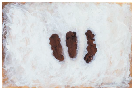
Anish KAPOOR. Sans titre , 1987.

→ Pour chaque exposition, une rencontre découverte est proposée aux enseignants et aux animateurs de groupes constitués. Animée par les médiateurs du frac picardie, elle se veut un temps d'échange vivant autour de l'exposition. Pour en connaître les dates, consulter l'agenda des expositions sur www.frac-picardie.org .