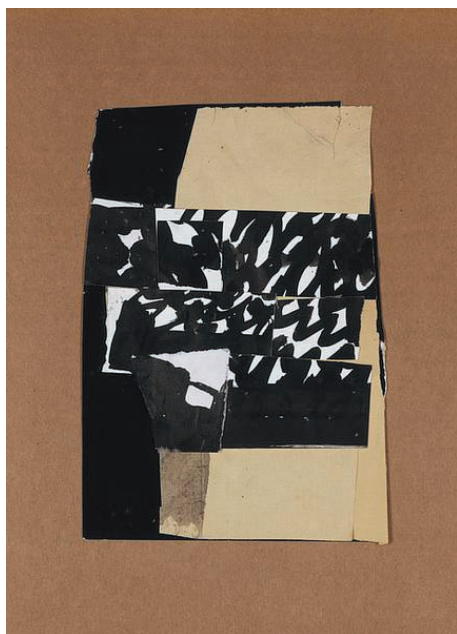
Pierrette BLOCH. Sans titre , 1971.

→ Thématiques proposées : dessin hors papier : le mur et la lumière outil du dessin.