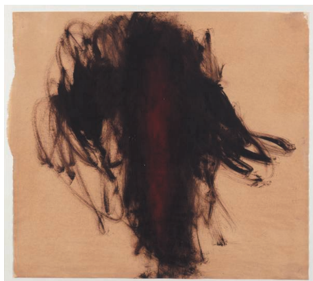
Anish KAPOOR. Sans titre , 1989.

→ Pour chaque exposition, une rencontre découverte est proposée aux enseignants et aux animateurs de groupes constitués. Animée par les médiateurs du frac picardie, elle se veut un temps d'échange vivant autour de l'exposition. Pour en connaître les dates, consulter l'agenda des expositions sur www.frac-picardie.org .